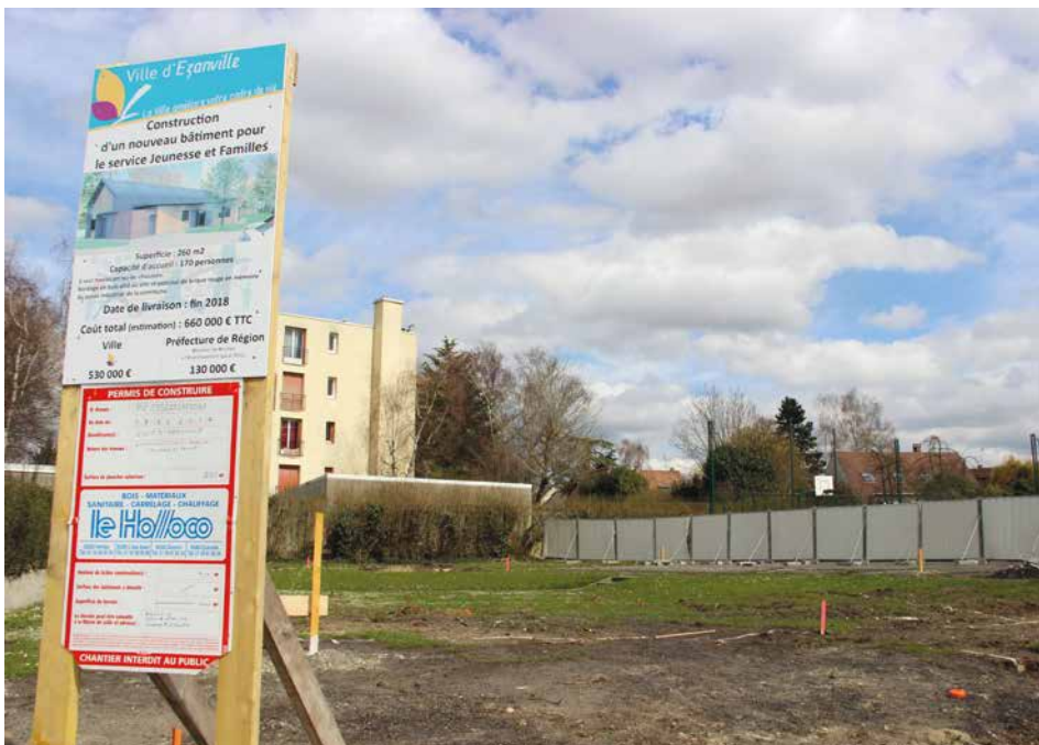
▲ La construction de la Maison de la Jeunesse et des Familles devrait débuter ce mois-ci.