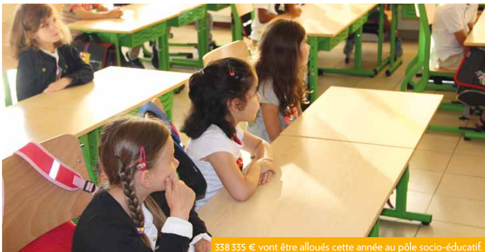
338 335 € vont être alloués cette année au pôle socio-éducatif.