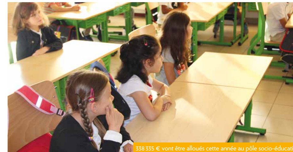
338 335 € vont être alloués cette année au pôle socio-éducatif.

Dès 2017, la Ville est en capacité d'inscrire une enveloppe de crédits nécessaires au financement de deux projets structurants. La totalité de ces dépenses ne sera certes pas réalisée dans l'année, mais le choix a été fait de réserver d'ores et déjà les crédits nécessaires à leur financement. • 580 000 € pour la construction de la nouvelle structure d'accueil de la jeunesse et des familles. • 600 000 € pour l'aménagement du futur centre culturel.