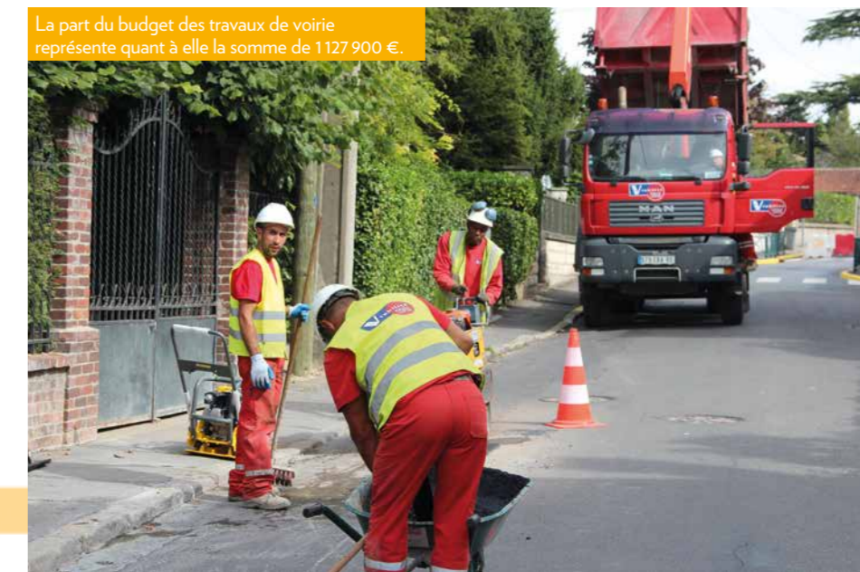
La part du budget des travaux de voirie représente quant à elle la somme de 1 127 900 €.