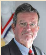
ALAIN BOURGEOIS MAIRE D'ÉZANVILLE