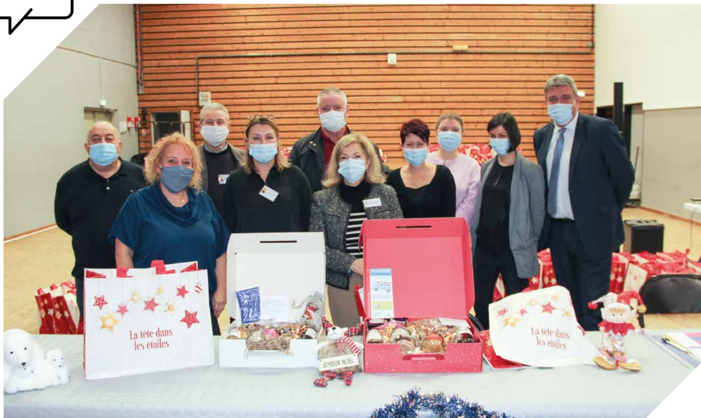
9/10 décembre : l'équipe du Centre Communal d'Action Sociale (C.C.A.S.), accompagnée des élus, a distribué les coffrets de Noël offerts par la Ville aux seniors.